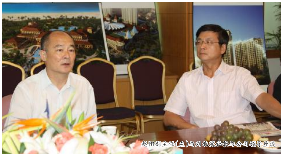
赵阳副主任(左)与刘北亮社长与公司领导座谈

本报讯 8月10日,国务院侨务办公室副主任赵阳在中国新闻社社长刘北亮的陪同下,莅临我集团公司视察工作。