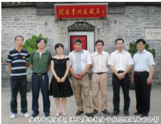
分公司部分党员和入党积极分子在总理故居前合影

本报讯(南京分公司林德华)我集团公司南京分公司党支部自2008年3月成立以来,十分重视党建工作,积极组织党员开展党日活动。两年来,支部组织全体党员和入党积极分子先后参观了黄花塘新四军军部纪念馆和革命圣地