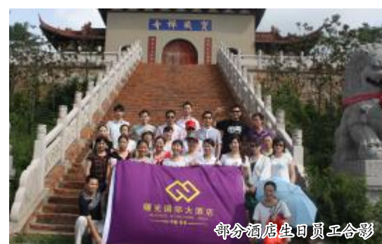
部分酒店生日员工合影